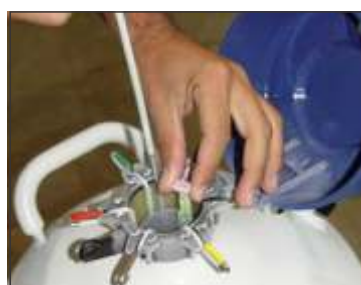
Armazenamento de sêmen