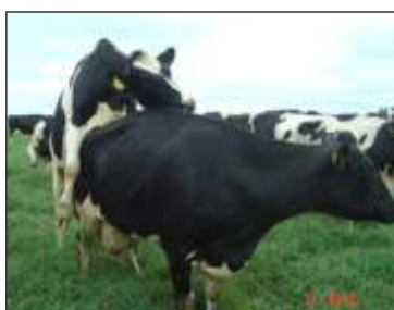
Observação de cio

Nutrição, controle sanitário, ambiente e genética são fatores que interferem na eficiência reprodutiva.