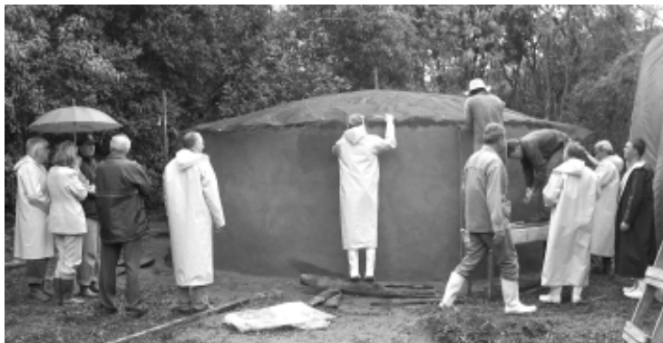
Técnicos recebem treinamento para a construção de cisternas

As cisternas poderão ser construídas em ferrocimento, técnica de construção relativamente simples e barata, que permite aproveitar a mão-de-obra local mediante um simples treinamento. Segundo o chefe de gabinete adjunto da Secretaria da Agricultura do Rio Grande do Sul e coordenador do Programa, Sérgio Sady Musskopf, o programa prevê também o armazenamento de água em