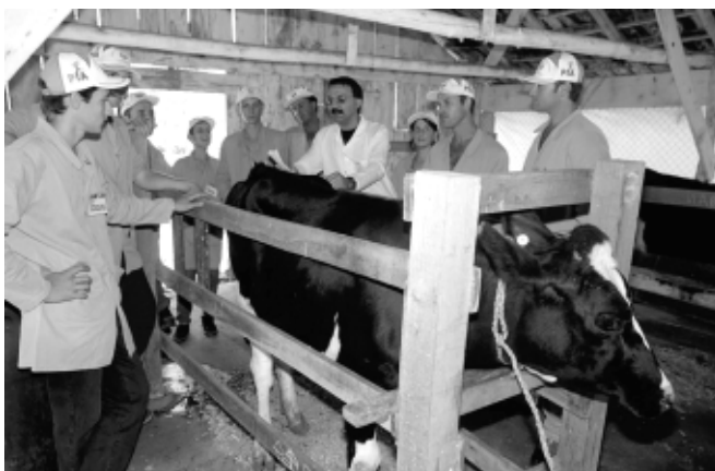
CETANP qualifica produtor no segmento leiteiro

De 22 a 24 de novembro de 2005, foi realizado em Porto Alegre, o Seminário “Educação e Qualificação de Produtores”, onde foram discutidos os temas Educação de Jovens e Adultos e Normatização dos Centros de Treinamento. Estiveram em debate a capacitação dos instrutores dos centros, a formação didático-pedagógica destes e a qualificação tecnológica das unidades. Também foram levantadas questões sobre a gestão dos centros e a necessidade de criação de um conjunto de normas. Na ocasião, foi proposta a criação de um conselho estadual de divulgação das atividades e um conselho técnico administrativo para cada centro.